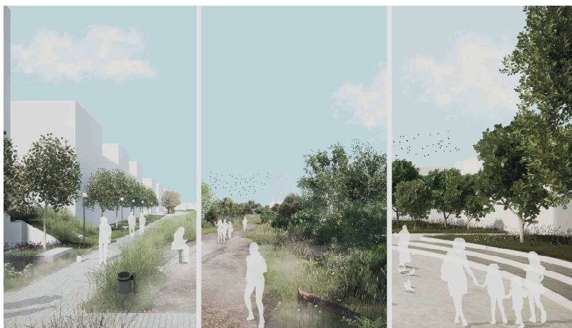
Obr. 6: Diferenciácia rôznych typov návrhových zelení v urbanizovanom území. Zľava: medzibloková sídelná zeleň, rastlá zeleň medzi rodinnými domami a parková zeleň pri námestí.

starostlivosti, zeleň mestských námestí a peších zón, líniová zeleň (v uliciach), izolačná zeleň a ostatná zeleň.