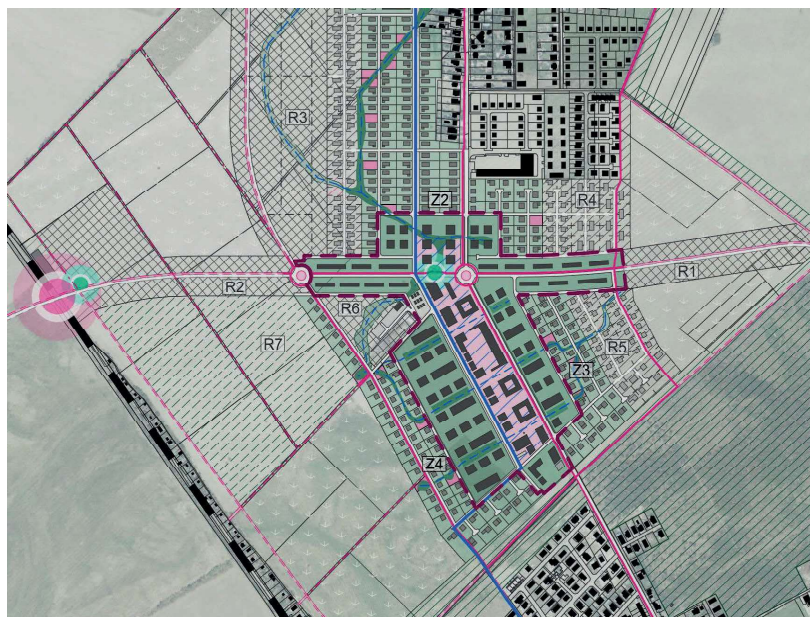
Obr. 3: Riešené územie – polyfunkčné centrum (ružová) a okolité obytné bloky. Z2, Z3, Z4 – navrhované individuálne bývanie v rodinných domoch, R1, R2, R3, R4, R5 – rezervné plochy na bývanie, R7 – rozvojová plocha pre rekreáciu.