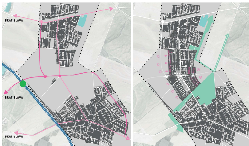
Obr. 1 naľavo: Dopravná infraštruktúra – ružová: existujúce hlavné komunikácie, magenta: navrhované hlavné komunikácie, modrá: železničná trať, zelená: navrhovaná železničná zastávka. Napravo: Posilnenie zelených plôch, vyznačenie maximálnej prípustnej urbanizácie.