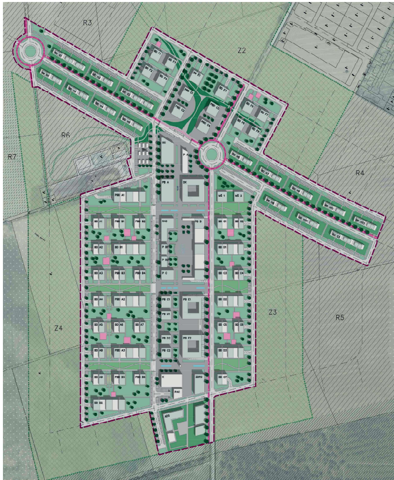
Obr. 4: Riešené územie v rámci Urbanistickej štúdie - navrhovaná situácia, júl 2020.

Niektoré z týchto funkcií už obec Miloslavov má vybudované (ako napríklad štadión s ihriskom 100 x 65m a pod.), v našom texte sú však uvedené všetky druhy vybavenosti z dôvodu prezentácie uceleného prehľadu funkcií.