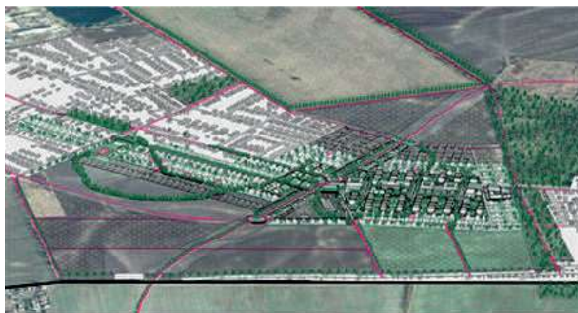
Obr. 2: Axonometrické zobrazenie prepojenia dvoch satelitných štruktúr zo západnej strany. Existujúca štruktúra naľavo: Miloslavov, zlomok existujúcej štruktúry napravo: Alžbetin Dvor.